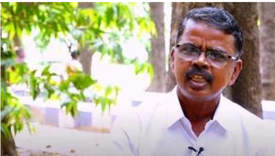
BBC ஜோதி சிவஞானம்

இதற்கு முக்கியமான காரணம், ஐந்தரை லட்சம் கோடி ரூபாய் வர வேண்டிய வரி வருவாய் வரவில்லை. நேரடி வரி வருவாயில் மட்டும் நான்கரை லட்சம் கோடி ரூபாய் வரவில்லை. இந்த காலகட்டத்தில்தான் கார்ப்பரேட் நிறுவனங்களுக்கு வருவாய், சொத்து மதிப்பு, லாபம் ஆகியவை அதிகரித்திருக்கிறது. ஆனால், அரசுக்கு வரி வருவாய் குறைந்திருக்கிறது. சில ஆண்டுகளுக்கு முன்பாக கார்ப்பரேட் நிறுவனங்களுக்கு வரிச் சலுகை அறிவிக்கப்பட்டது. வரி சதவீதம் 32லிருந்து 22ஆக குறைக்கப்பட்டது. இதன் மொத்த மதிப்பு 1.45 லட்சம் கோடி என்றார்கள். பிறகு இது 1.55 லட்சம் கோடியாக உயர்த்தப்பட்டது. முதலில் இந்தச் சலுகை அந்த ஆண்டுக்கு மட்டும் என்றுதான் கருதப்பட்டது. ஆனால், ஒவ்வொரு ஆண்டும் இந்தத் துண்டு விழுந்தது.