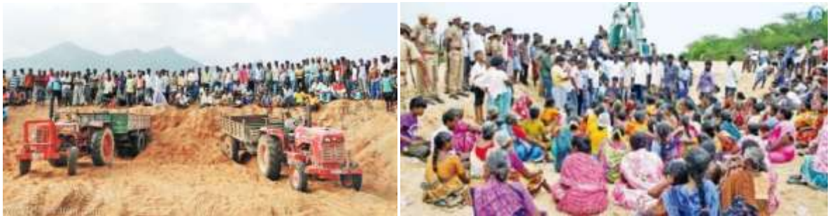
கொள்ளிடம் ஆற்றில் மணல் கொள்ளைக்கு எதிராக மக்கள்

“கரூர் மாவட்டத்தில், மண்மங்கலம் வட்டம், நெரூர் வடக்கு (மல்லம்பாளையம்) 4.90 ஹெக்டேர் பரப்பளவில் புதிய மணல்குவாரி அமைக்க, மாநில சுற்றுச்சூழல் தாக்க மதிப்பீட்டு ஆணையம் அனுமதி அளித்துள்ளது. இந்த இடத்துக்கு அருகே, 500 மீட்டர் தூரத்தில் ஏற்கனவே மணல் குவாரிகள் செயல்பட்டன.