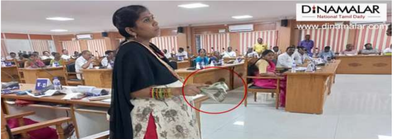
லஞ்சம் கேட்கும் அதிகாரிகள்: பணத்துடன் வந்த தி.மு.க., கவுன்சிலர்

இதனால் மாதனூர் ஊராட்சி ஒன்றியத்தில் பரபரப்பு ஏற்பட்டுள்ளது.