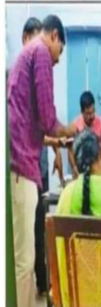
களியல் வி.ஏ.ஓ. கைது

லஞ்ச ஒழிப்பு போலீஸிடம் கையும் களவுமாக சிக்கினார்