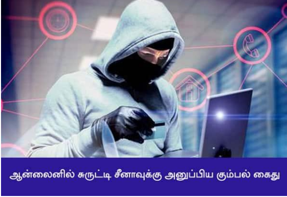
ஆன்லைனில் சுருட்டி சீனாவுக்கு அனுப்பிய கும்பல் கைது

சுருட்டியிருப்பது விசாரணையில் தெரியவந்தது. இந்த பணம், 'கிரிப்டோ கரன்சி'களாக மாற்றப்பட்டு துபாய் வழியாக சீனாவுக்கு அனுப்பப்பட்டுள்ளது.