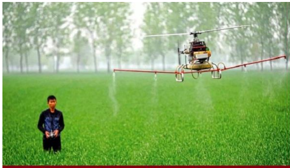
கார்பரேட்ஸுக்கு காவடி தூக்கவா அறிவு!

“விளைச்சலை அதிகரிக்கவே ரசாயன உரங்களை அறிமுகப்படுத்தினோம்” எனச் சொல்கிறார்கள்! அந்த ரசாயன உரங்களால் மண் வளம் குறைந்தது. ஆகவே, “இன்னும் வீரிய ரசாயன உரங்களைப் போடுங்கள்” என சிபாரிசு செய்தார்கள்! விவசாயிகளும் கூடுதல் பணம் செலவழித்து வீரிய ரசாயன உரங்களை வாங்கினார்கள்! அவை இன்னும் மண்ணின் வளத்தை சூறையாடின! இதனால், மண்ணில் உள்ள இயற்கை சத்துக்கள் எல்லாம் உறிஞ்சப்பட்டு அது மலட்டு மண்ணாகிவிட்டது. ஒரு கட்டத்தில் அந்த மண் விவசாயத்திற்கே பயனில்லாமல் ஆனது. இந்த வகையில் இன்று இந்தியாவின் மூன்றில் ஒரு பங்கு விவசாய நிலங்கள் பயன்பாடு இல்லாமல் போய்விட்டன! இன்றும் தொடர்ந்து ரசாயன உரங்களைப் பயன்படுத்தி வருபவர்களைக் கேட்டால், ‘எங்கள் நிலங்களில் உற்பத்தி குறைந்துள்ளது’ என்பதை ஒத்துக் கொள்வார்கள்!