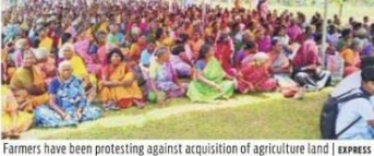
Farmers have been protesting against acquisition of agriculture land

THE STATE government is in the process of booking seven farmers who staged sit-in protest against the acquisition of their land for SIPCOT under the Goondas Act. The submission was made by the government during the bail plea hearing at the Tiruvannamalai district court on Wednesday. The matter has been adjourned to November 20.