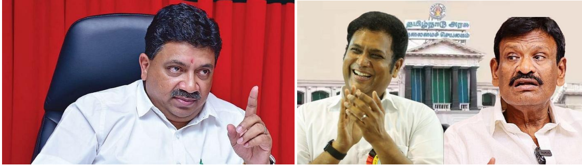
அமைச்சரவை மாற்றம் பழனிவேல் தியாகராஜன்

“அமைச்சரவை மாற்றம் என்பது முழுக்க முழுக்க முதலமைச்சரின் பிரத்யேக உரிமை. அமைச்சரவை, இலாகா மாற்றம் தமிழக நலன் மற்றும் வளர்ச்சியை மையப்படுத்தியதே தவிர எந்த அரசியல் காரணங்களுக்கும் இடமில்லை” என்கிறார்கள் தி.மு.க-வினர். தமிழக அமைச்சரவையில் மாற்றங்கள் நிகழ்ந்து தகவல் தொழில்நுட்ப அமைச்சராக நியமிக்கப்பட்டிருக்கிறார் பி.டி.ஆர் பழனிவேல் தியாகராஜன் . அமைச்சரவைக்குள் புதிதாகத் தொழில்நுட்ப அமைச்சராக என்ட்ரி கொடுத்திருக்கிறார் டி.ஆர்.பி.ராஜா. புதிய நிதியமைச்சராக நியமனமாகியிருக்கிறார் தங்கம் தென்னரசு . அமைச்சரவை மாற்றம் ஒரு பக்கம் இருந்தாலும் பி.டி.ஆர்.பழனிவேல் தியாகராஜனிடமிருந்து நிதித்துறை பறிக்கப்பட்டிருப்பதுதான் தமிழக அரசியலின் ஹாட் டாப்பிக்