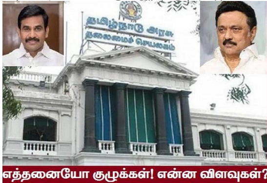
எத்தனையோ குழுக்கள்! என்ன விளவுகள்?

எடுத்ததற்கெல்லாம் குழு அமைப்பது, அதற்கு தகுதியற்ற தலைவர்களைப் போடுவது, கௌவத்திற்காக சிலரை உறுப்பினராகப் போடுவது, குழு செயல்படுவதற்குத் தோதான சூழ்நிலைமைகளை உருவாக்கத் தவறுவது, அதில் திடீரென ஐ.ஏ.எஸ் அதிகாரிகள் தலையிட்டு அதிகாரம் செய்வது... இதற்கு தீர்வு தானென்ன?