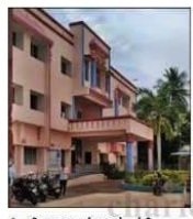
திருவாரணகைகாவல் சபை நபர் இடத்தில் வட்டாட்சியர் அலுவலகம்.

யர், உடையபட்டினம் வட்டாட்சியர் அலுவலகம் கட்டப்பட்டுள்ளதாக இந்து சமய அறநிலையத் துறை நோட்டீஸ் அனுப்பியது தெரியவந்தது. மேலும் பித்தூர், திருவாரூர், மாத வாடகை செலுத்தாததால் அந்த நோட்டீஸ் வட்டாட்சியர் அலுவலகம் கட்டப்பட்டுள்ளது. திருச்சி மாவட்ட வருவாய் நிர்வாகத்தில் ஷரீங்கம் வட்டாட்சியர் அலுவலகம் உருவாக்கப்பட்டபோது தற்போதுள்ள அந்தளவு அலுவலகம் ஷரீங்கத்திலுள்ள ஒரு நிர்வாகம் 1 நிமிர் இடத்தில் இருக்க வேண்டும் என்று 2008-ம் ஆண்டு திருவாரணகைகாவல் சபை நபர் இடத்தில் வட்டாட்சியர், ஷரீங்கம் பகுதி காப்பீட்டு திட்ட தனி வட்டாட்சி