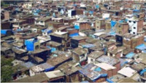
தாராவி குடிசைப் பகுதி

மும்பையிலுள்ள தாராவியில் இருக்கும் குடிசைகளை இடித்துவிட்டு, அங்கு அடுக்கு மாடிக் குடியிருப்புகளைக் கட்டும் பொறுப்பு டெண்டர் மூலம் அதானி நிறுவனத்துக்குக் கொடுக்கப்பட்டிருக்கிறது. ஆனால், அதானி நிறுவனத்துக்கு இந்தப் பணியைக் கொடுத்து அந்த நிறுவனம் பயனடையும் வகையில் விதிகளில் மாநில அரசு திருத்தம் செய்திருப்பதாக எதிர்க்கட்சிகள் குற்றம்சாட்டியிருக்கின்றன. இது தொடர்பாக தாராவி தொகுதி எம்.எல்.ஏ வர்ஷா கெய்க்வாட் ஏற்கெனவே போராட்டம் நடத்தியிருக்கிறார். தற்போது உத்தவ் தாக்கரேயும் போராட்டம் நடத்தப்போவதாக அறிவித்திருக்கிறார். இது குறித்து அவர் அளித்திருக்கும் பேட்டியில், "மாநில அரசு அதானி நிறுவனத்துக்குச் சாதகமாக விதிகளில் திருத்தம் செய்திருக்கிறது.